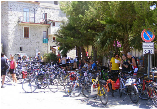
(Acciaroli, Cicloraduno Nazionale FIAB 2010)